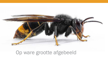
Op ware grootte afgebeeld

Lees in het kader rechts wat u het beste kunt doen als u een voorjaarsnestje van de Aziatische hoornaar aantreft.